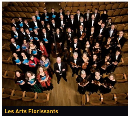
Les Arts Florissants

L'univers de Lully, l'emblématique surintendant de la musique du roi. Du Louvre à Versailles, le cœur du siècle de Louis XIV, de ballet en pastorale et de comédie en divertissement. Toutes les facettes d'un art au service du souverain, qui danse pour la dernière fois en représentation dans Les Amants magnifiques . Des Plaisirs de l'Île enchantée , à l'aube d'un Versailles inachevé, au Bourgeois gentilhomme , les fêtes magnifiques d'un pouvoir revendiquant l'esthétique du spectacle. Aux côtés de Lully, des airs de cour de son gendre Michel Lambert et une églogue de Charpentier, musicien de la duchesse de Guise et du Grand Dauphin.