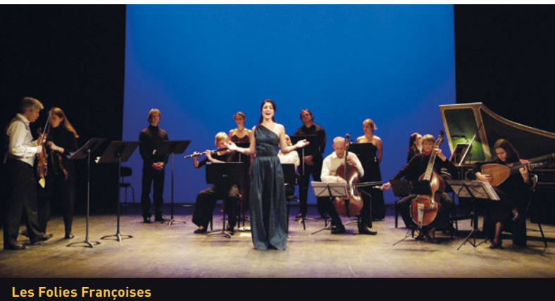
Les Folies Françaises

L'univers du petit motet français autour du 350 ème anniversaire d'André Campra, maître de musique à Notre-Dame de Paris avant d'accéder à la Chapelle royale en compagnie de Nicolas Bernier. Dans la seconde partie du Grand Siècle et jusqu'à la Régence, une référence à la notion des goûts réunis, mêlant l'élégance française à la vivacité italienne, sous la plume de musiciens nourris des deux cultures. Parallèlement, les couleurs de l'orgue classique français entre deux siècles.